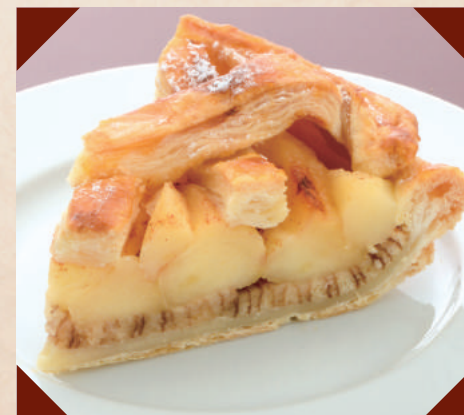
高畠産りんごのアップルパイ ¥400 (税別)