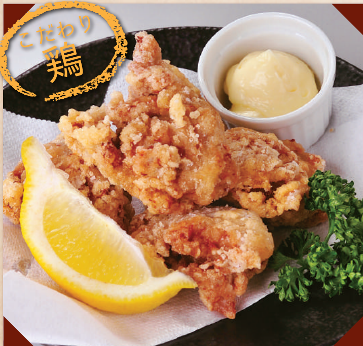
山形さくらんぼ鶏の唐あげ ¥500 (税別)