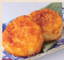
オリジナル 焼きおにぎり 2個 ¥150 (税別)