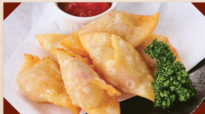
自家製洋風揚げ餃子 ¥350 (税別)