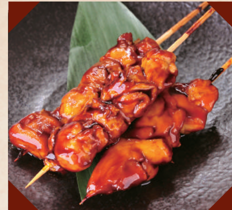
山形さくらんぼ鶏のやきとり(3本) ¥360 (税別)