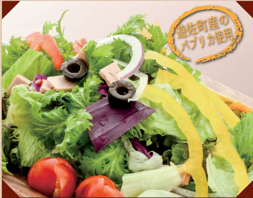
遊佐町産パプリカのサラダ ¥500 (税別)