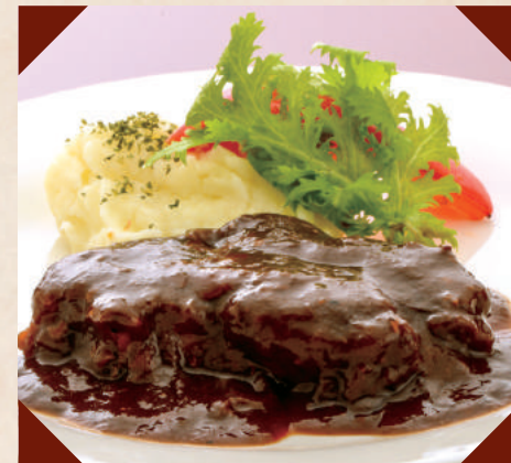
やわらかビーフシチュー ¥750 (税別)